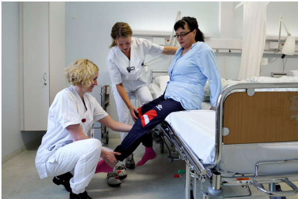
Illustrasjonsfoto fra Hofte-/Kneskolen.